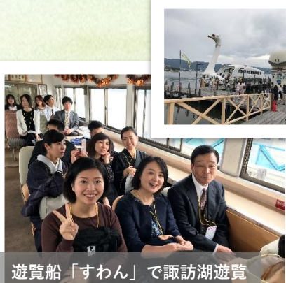
遊覧船「すわん」で諏訪湖遊覧