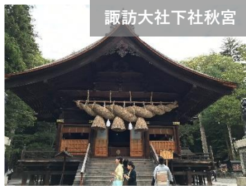
諏訪大社下社秋宮