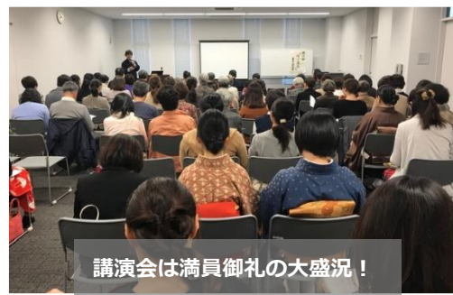
講演会は満員御礼の大盛況！