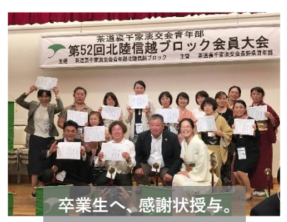
卒業生へ、感謝状授与。