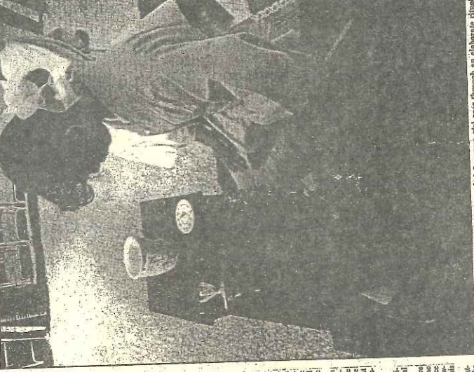
PEACE WITHIN A BOWL: A kimonos-clad Japanese girl goes through an elaborate ritual of tea ceremony in the Japanese consulate in Bombay on Saturday. (Picture by Hindi Jid.) (Report on Page 3)

By GAUTAM ADHIKARI Kashmir, the ancient prize out. On the other hand, there is a strong opposition, which is not only dominated by the powerful Parliamentarians but also by the public opinion. The Government has drawn the attention to Pakistan's activities in backing 'extremist' and 'adventurist' elements in the State. On the other hand, there is the military agreement and stressed that India will defend its unity, integrity and independence. At the same time, India's U.N. Ambassador, Mr. Chittambram Ghosh, who has just left for Geneva, requested him to advise the President to exercise restraint in a civilian-administered plan for the State. The opposition parties (J.P.), Mr. Mian Nawaz Sharif, has issued anonymous cables to the Government over the Kashmir issue and said that all political parties represent the Indian people. The Government has been significant about the Indian foreign secretary's statement that there is no change in the United States policy of support for India. Mr. Singh said that the United States has not changed its policy on Kashmir. He said that the United States has not changed its policy on Kashmir. He said that the United States has not changed its policy on Kashmir.