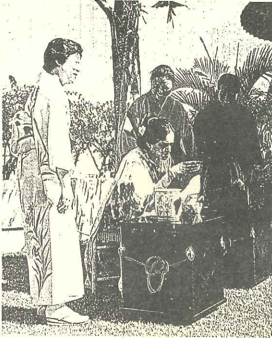
今年2月、ボンベイの日本領事館で開かれた茶会。日本文化への関心が高く、お点前を試みる人も多かった