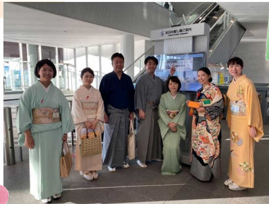
10/10 新潟支部70周年 記念講演会