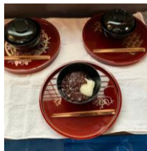
主菓子(温かい善哉を)