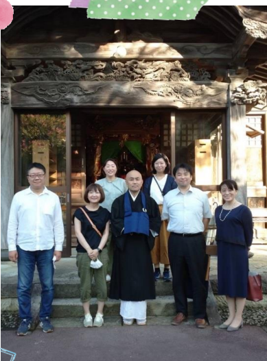
9/19 オンライン写経の納経