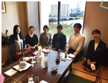
10/17 抹茶を飲もう!会(會津八一記念館編)