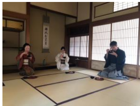
善哉をいただく卒業生(濃茶席)