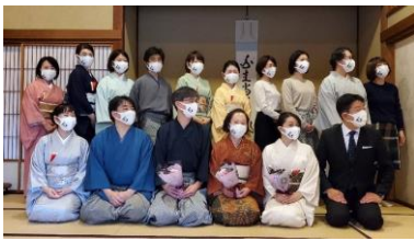
マスクをお土産に