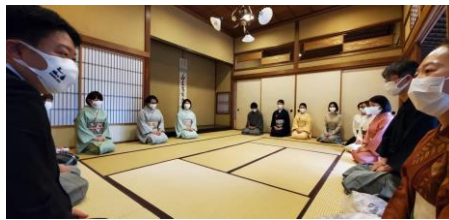
茶会後に茶話を開催みんなを思い出話にひたる