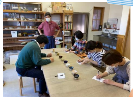
11/7 育成委員会主催 第2回物造り体験教室(陶芸)