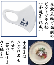
東京五輪で活躍のビクトグラム柄(茶道器作威)