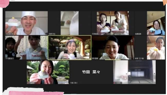
9/19 オンラインお菓子作り